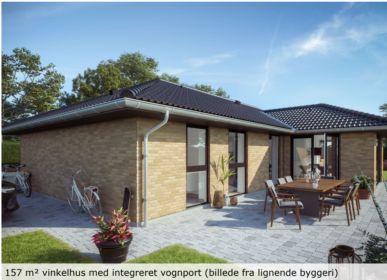
157 m 2 vinkelhus med integreret vognport (billede fra lignende byggeri)